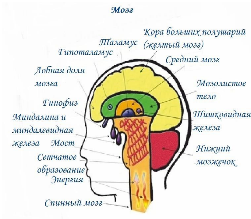
Рисунок - Мозг